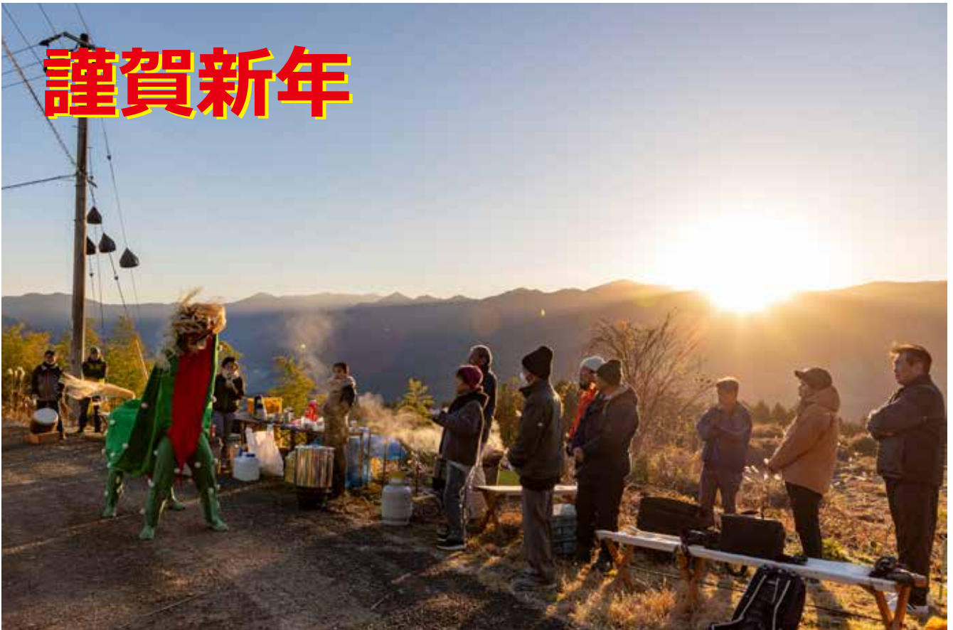
初日の出を背に立石獅子の舞