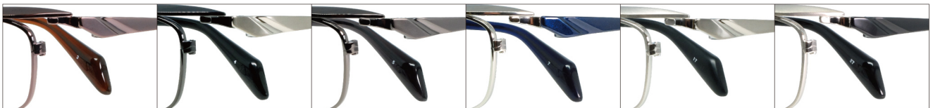
COL.3 IP.Brown COL.4 IP.Black/Titanium Mat COL.5 IP.Gray COL.7 Titanium/Blue COL.17 Titanium Mat COL.27 Titanium Mat/Black

DUN-2127 フルリム MENS サイズ：56□14-138（¥30.0）／カラー：6色／素材：ゴムメタル、チタニウム／生産地：日本・福井県鯖江