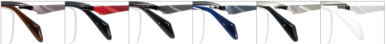
COL.3 IP.Brown COL.4 IP.Black/Red COL.5 IP.Gray COL.15 IP.Light Gray/Blue COL.17 Titanium Mat COL.27 Titanium Mat/Pearl White

DUN-2128 ナイロール MENS サイズ：55□15-138（¥30.1）／カラー：6色／素材：ゴムメタル、チタニウム／生産地：日本・福井県鯖江