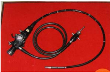
世界初の胃カメラ

平成21年3月に富士山静岡空港が開港します。 大交流に時代を迎えます。 静岡県には、日帰りで東アジア諸国の人々がたくさん訪れます。