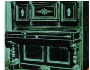
日本初の国産オルガン