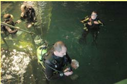
ガスタンク・ダイビング