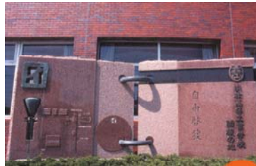
世界初のブラウン管テレビ