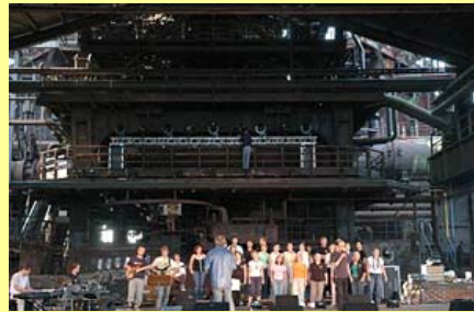
アイアン市民コンサート