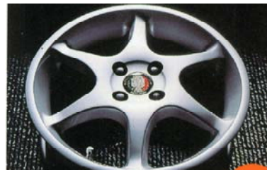
日本初の国産アルミホイール