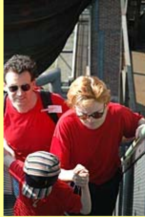
ファミリー溶鉱炉登山