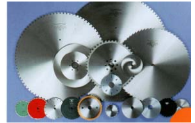
日本初の国産丸のこぎり