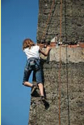
煙突のロッククライミング