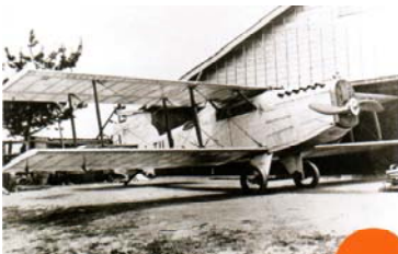
日本初の国産旅客機